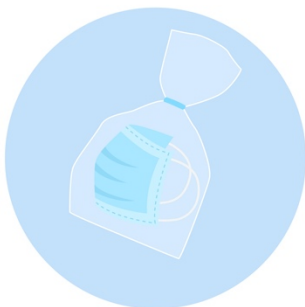
Put It In A Plastic Bag