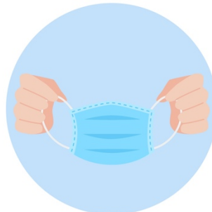
Remove The Mask