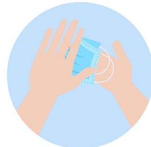
Fold The Mask