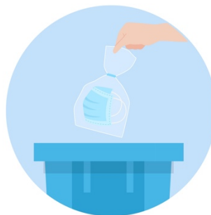
Discard In Closed Bin